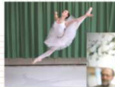
Győri Tánc- és Képzőművészeti Iskola

A Győri Tánc- és Képzőművészeti Iskola bemutatója Csipkerózsika – Carmen – Ölelés – Diótörő – Pas de trois – Hófehérke – 1.2.3 – Mea Culpa