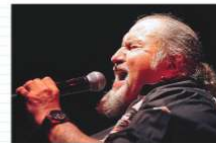
Belépőjegy: 1000 Ft