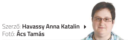
Szerző: Havassy Anna Katalin

„Terhességi diabétesznek és 4-es típusú cukorbetegségnek is hívják. Jellemzője az áldott állapot alatt lévő magas vércukorszint, amelyet először csökkent glükóztoleranciaként diagnosztizálnak. A nők 7-8 százalékánál jelentkezik, főként a 20-24. hét környékén, a szülés után pedig megszűnik” – kezdte a doktornő, majd azzal folytatta, hogy mi okozza.