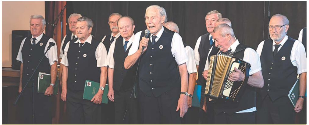
Az ünnepi műsorban többek között fellépett az Obsitos dalárda.

Az ülésen szóba került, hogy a háziorvosi ügyelet rendszere jelentős átalakulás előtt áll. „Az illetékes szolgáltató felmondta a szerződést december elsejétől, és megváltozik a rendszer. A háziorvosi ügyeletet a kezdetektől szerettem volna elvinni a kórházba, hogy a sürgősségi osztály mellett működjön. A betegek számára ugyanis ez a legoptimálisabb megoldás” – mondta a polgármester. A városvezető szerint az átalakítással ki lehet küszöbölni, hogy valaki négy-öt órán keresztül várakozzon a sürgősségi osztályon az ellátásra. Sokan ugyanis olyan problémával érkeznek ide, amivel a háziorvosi rendelőbe kellene