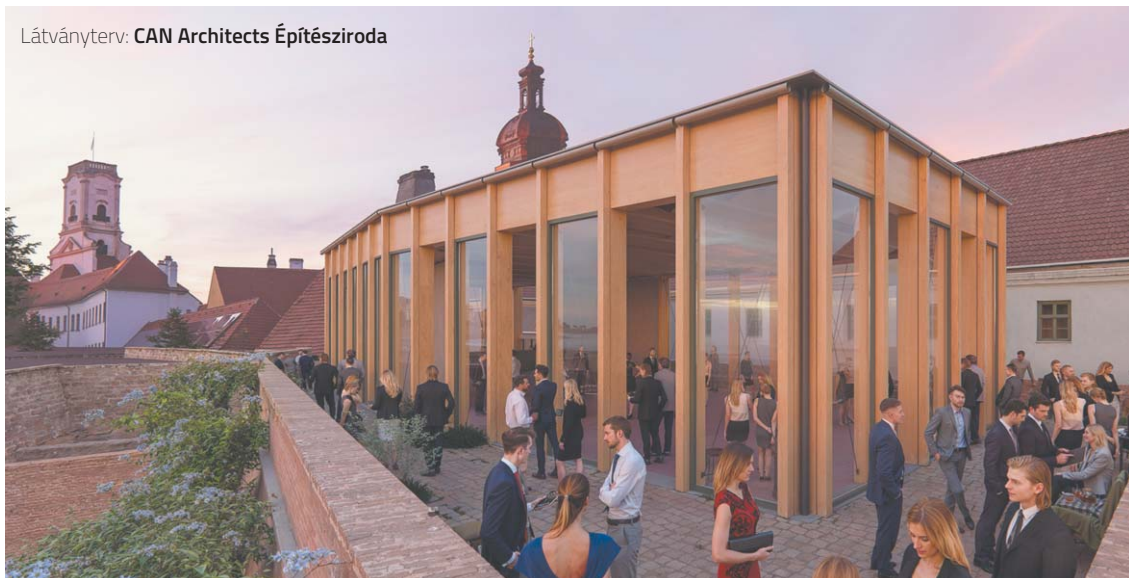
Látványterv: CAN Architects Építésziroda

Jelenleg tehát kész építési engedélyezési tervekről beszélünk, ezt követi majd a kivitelezési tervek elkészítése, melyek megvalósításához azonban komoly forrásokra van szükség, ez a következő évek munkája lesz.