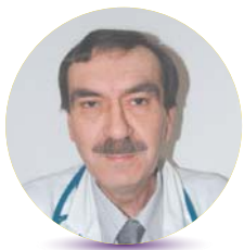
Szerző: Dr. Strényer Ferenc belgyógyász, kardiológus főorvos

A szindróma tünetcsoportot, tünetegyüttest jelent, tehát bizonyos tünetek egyidejű előfordulásáról van szó. A hasra törtető, „alma” típusú elhízás, emelkedett vércukor, magasabb vérnyomás, emelkedett vérzsírszintek gyakran jár együtt. Ezek együttes előfordulása olyan nagy mértékben fokozza nemcsak a szív-érrendszeri, de a vese- és a májmegetegedések előfordulásának kockázatát, hogy halálos négyesnek is hívják.